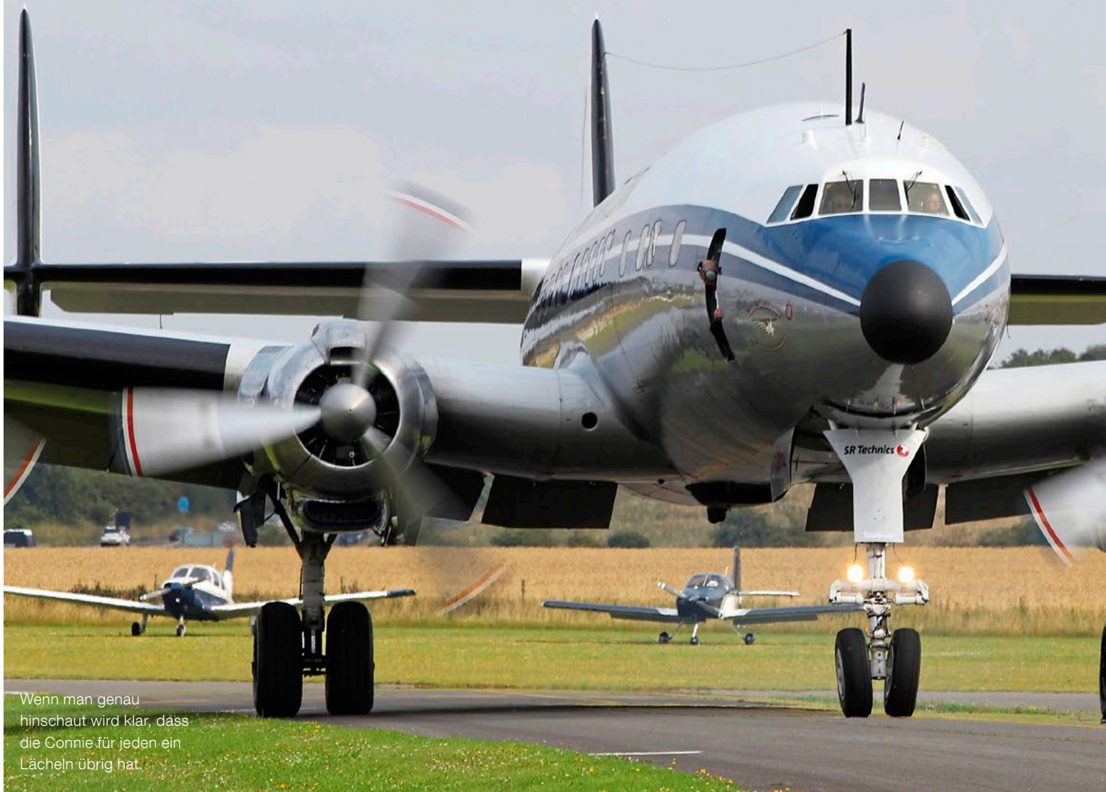
Wenn man genau hinschaut wird klar, dass die Connie für jeden ein Lächeln übrig hat.