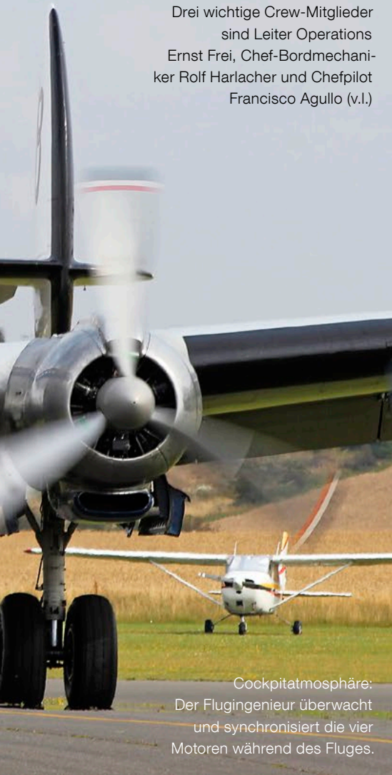
Cockpitatmosphäre: Der Flugingenieur überwacht und synchronisiert die vier Motoren während des Fluges.